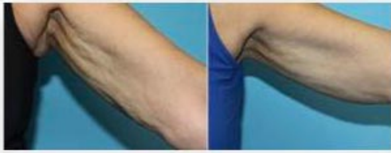
Celulitis en Brazos